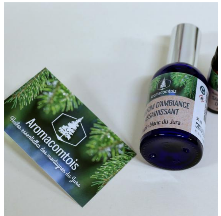
Voilà : l'huile essentielle de résineux existe désormais en Franche-Comté.

Une reconversion pour être au cœur du territoire et de l'humain.