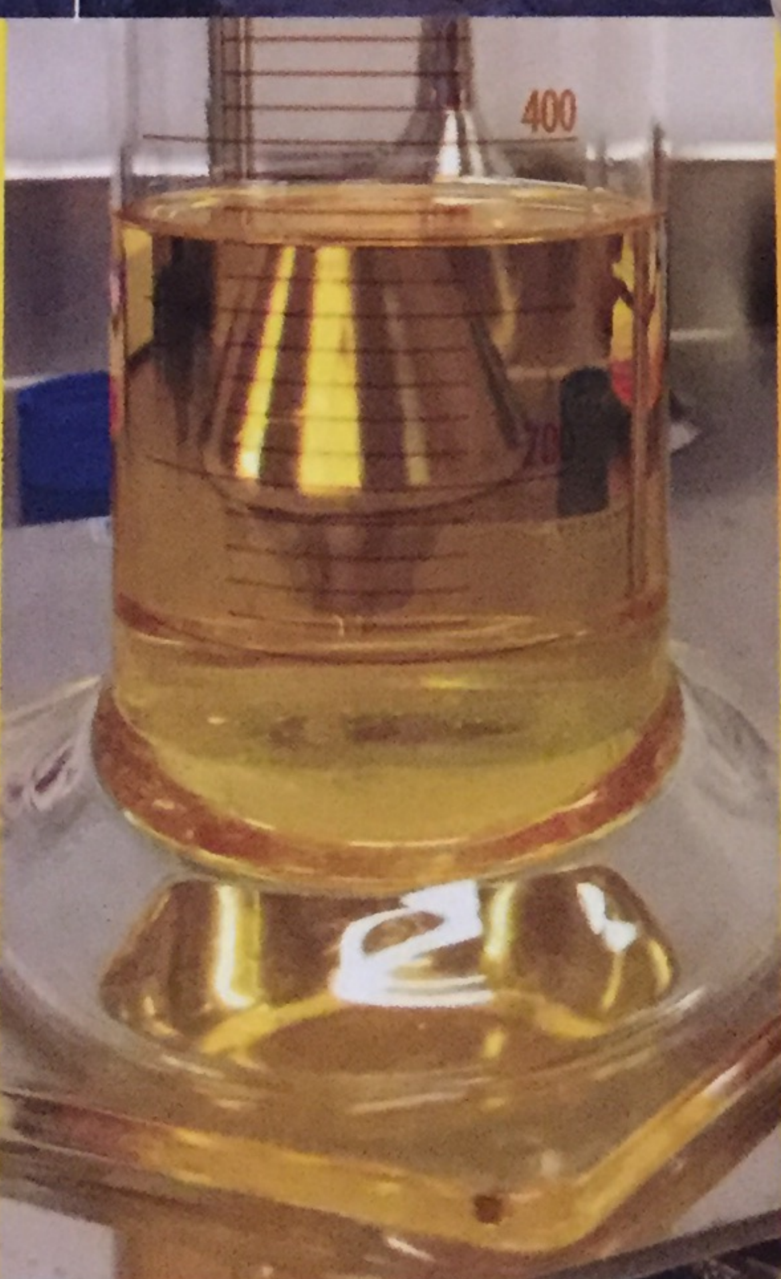
④ La spectroscopie d'absorption de rayons X pour localiser des gisements d'or sur le SYNCHROTRON EUROPÉEN (ESRF)