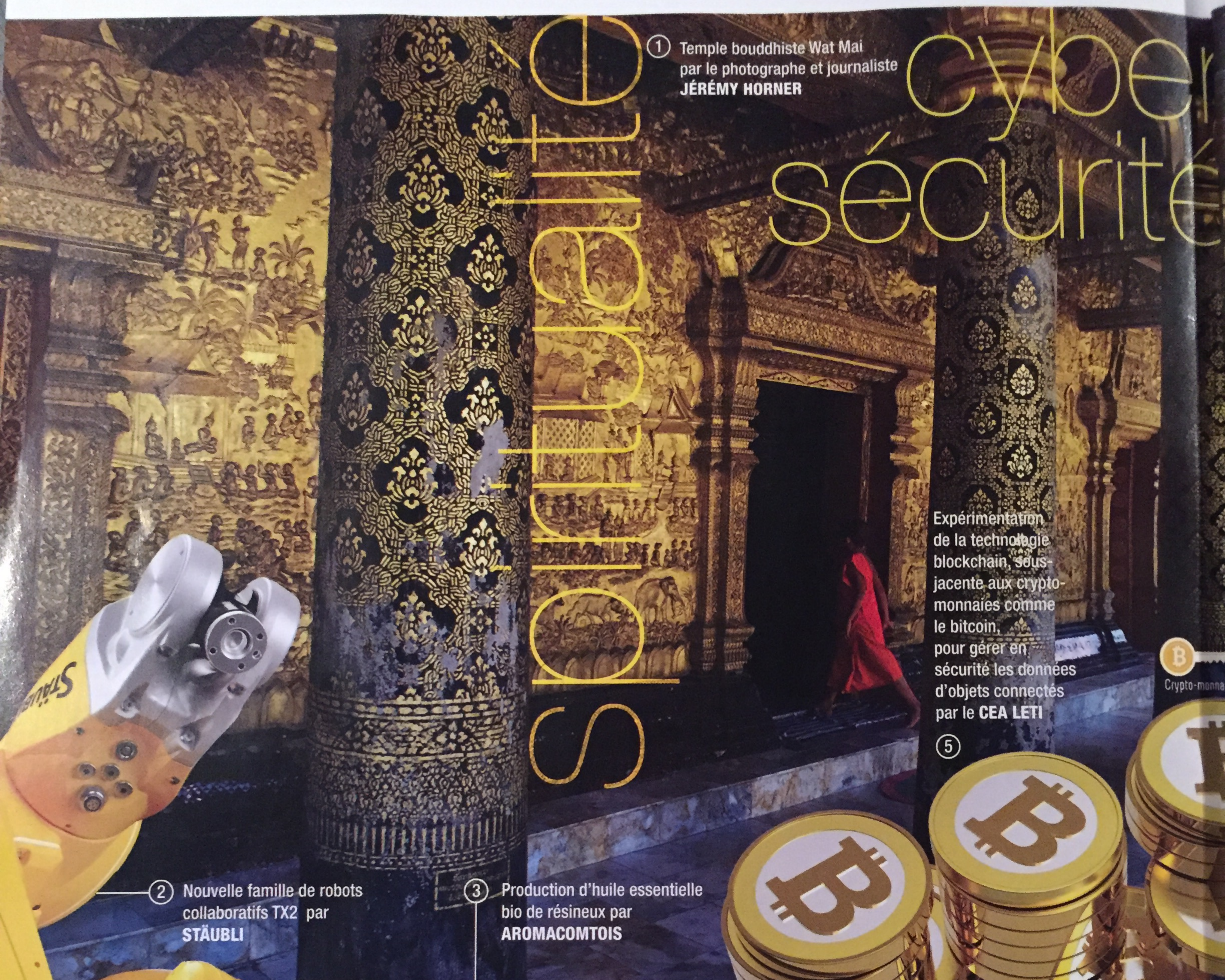
① Temple bouddhiste Wat Mai